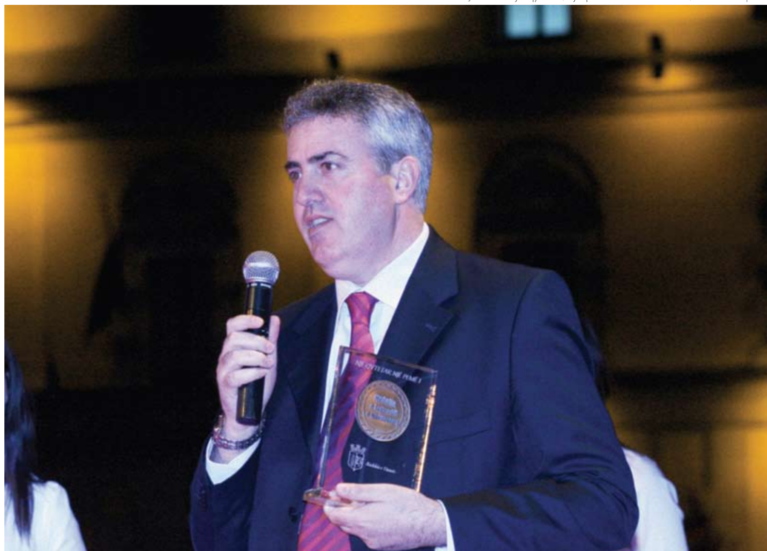
Çmimi "Një qytetar, një pemë" / "One Citize, one tree" price