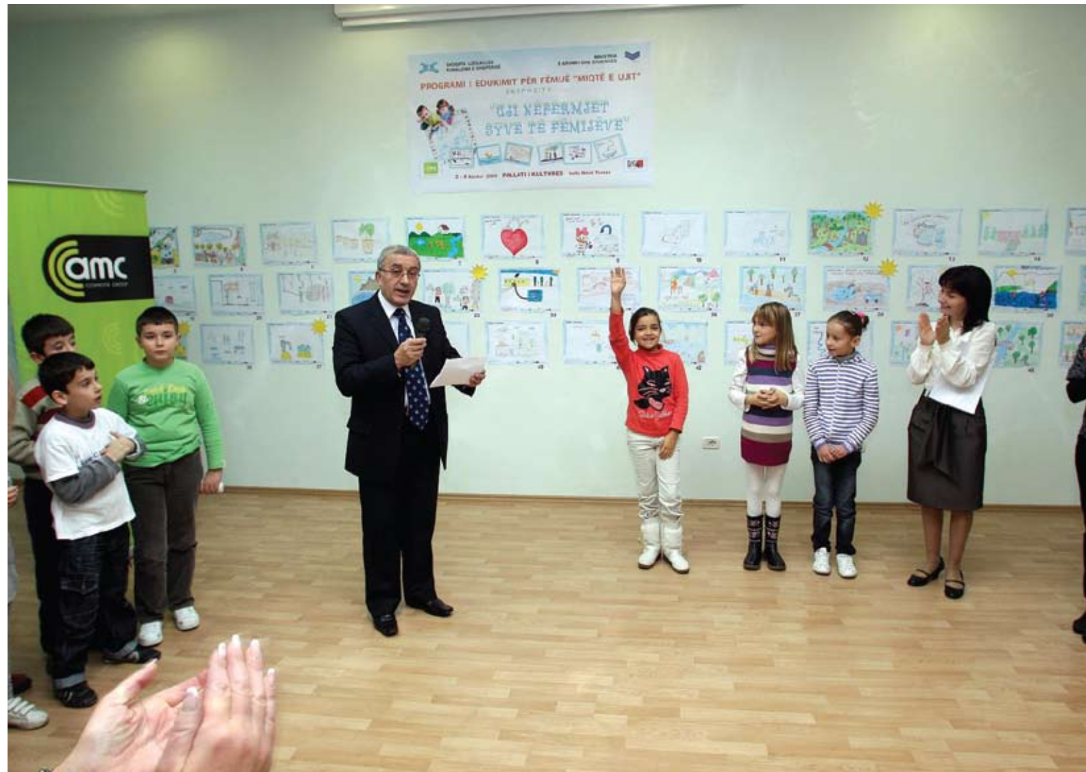
Miqtë e Ujit / Friends of Water