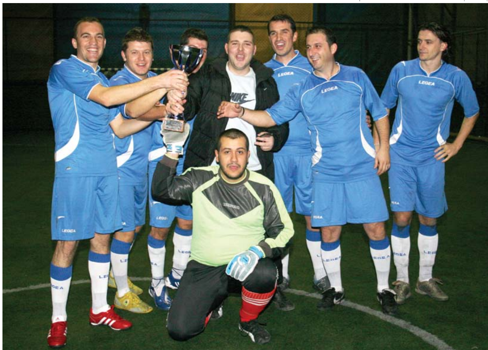
Kampionati i futbollit / Football championship