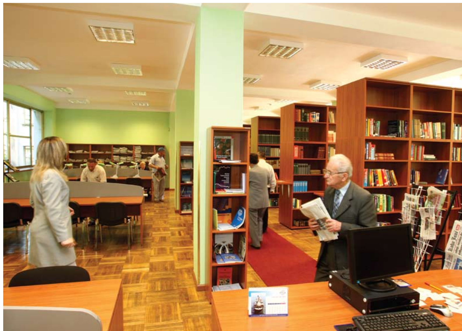
Rinovimi i Bibliotekes Kombëtare / National Library Reconstruction