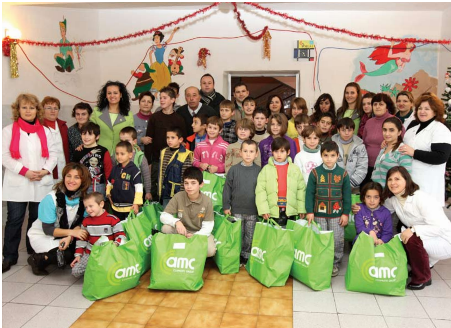
Vizita e fundvitit në jetimoren Sarandë / End of Year visit in Orphanage of Saranda