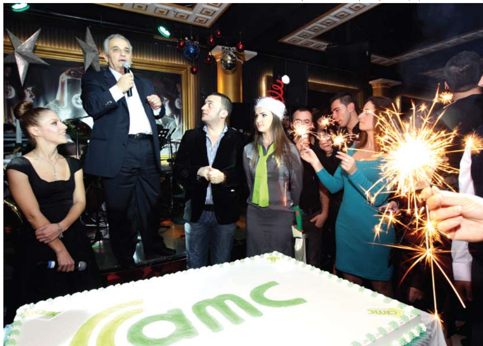
Mbrëmja e Vitit të Ri me punonjësit / Employees Christmas Party