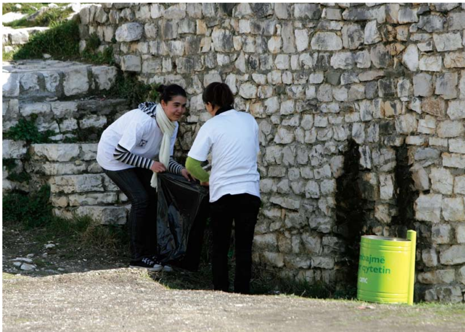
Vendosja e koshave të mbeturinave në Berat / Waste bins in Berat