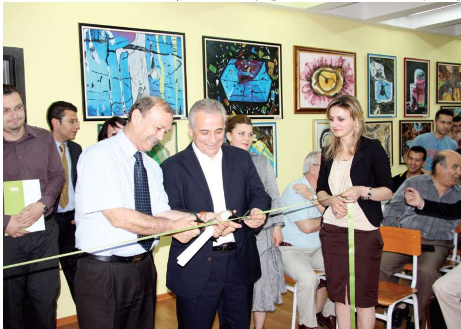
Rikonstruksioni i Sallës së Ekspozitave në Fakultetin e Gjeologjisë / Reconstruction of Exhibition Room in Faculty of Geology