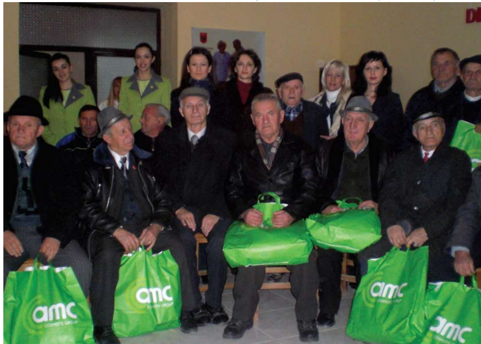
Vizita e fundvitit në shtëpinë e të moshuarve - Tiranë / End of year visit in elderly home - Tirana