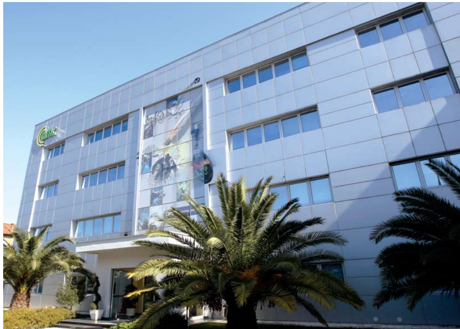
Zyrat Qendrore të AMC në Laprakë / AMC headquarters in Lapraka