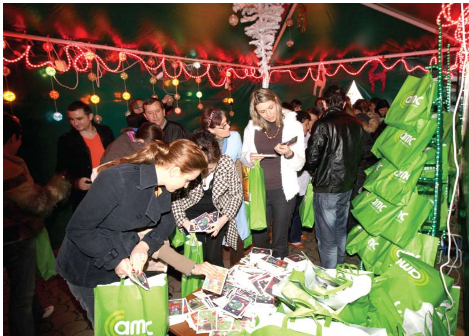
Viti I Ri në AMC / Christmas at AMC